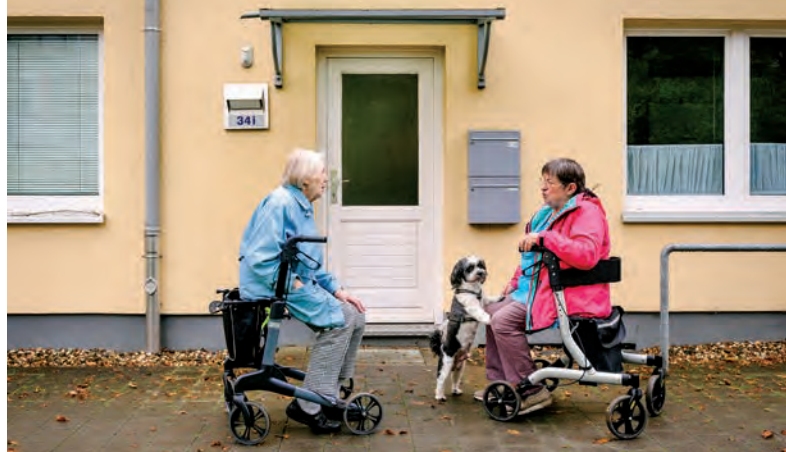
Passgenaue Unterstützung für ein selbstständiges und selbstbestimmtes Leben im Alter

QplusAlter der Ev. Stiftung Alsterdorf ist eine Kooperation der Bereiche Q8 Sozialraumorientierung und dem Ev. Krankenhaus Alsterdorf. Dabei werden Erfahrungen aus der Eingliederungshilfe, der Quartierentwicklung und der Altersmedizin zu einem neuen Ansatz entwickelt. Die Förderung erfolgt durch die SKala-Initiative sowie in Partnerschaft mit der Nordmetall-Stiftung, der Karin und Walter Blüchert Gedächtnisstiftung, der Homann-Stiftung und dem Deutschen Hilfswerk.