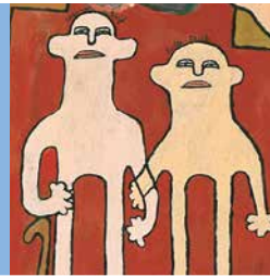
Bild: Werner Voigt Die Alsterdorfer Passion, 1984 © Freunde der Schlumper e. V.